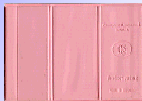
ŘP vydány v období: 1987-1991